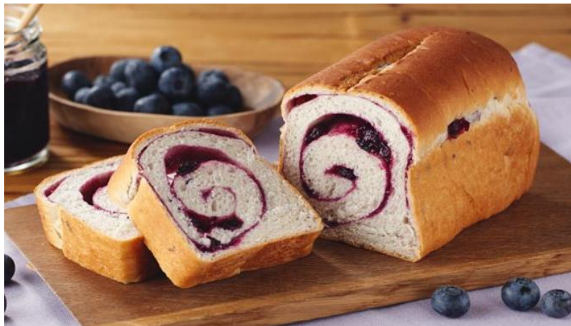
▲贅沢ジャムのうずまきブルーベリーブレッド